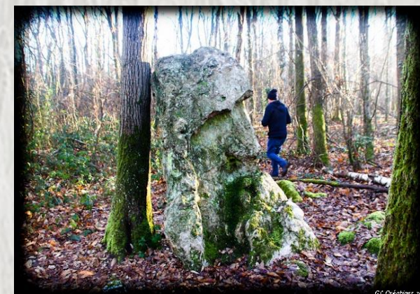
Le Menhir du Grand Berger

Ce parcours vous mènera tranquillement du bord de Seine au plateau à l'ouest de Melun, au travers une zone boisée. C'est une relique de l'arc forestier du IX e s. au sud et à l'est de Paris, englobant les bois de Livry, Bondy, Vincennes, Sénart et Rougeaux.