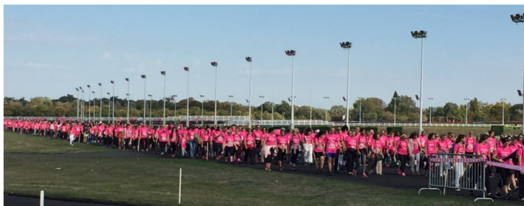
Quand Sports Loisirs participe à Octobre Rose.