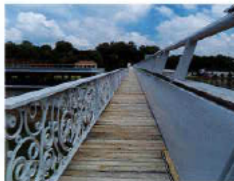
Passerelle publique de 184m de long

Les motifs des garde-corps de la passerelle publique évoquent les «vives-eaux» ou les eaux en mouvement.