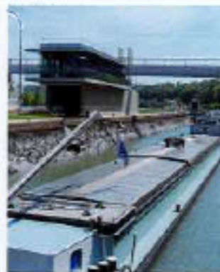
Bâtiment de commandes

Le barrage maintient un niveau d'eau nécessaire à la navigation fluviale sur 15 km jusqu'au barrage de la Cave à Bois-le-Roi. Sans ces barrages, la Seine dans son état naturel ne serait pas navigable en période de basses eaux, notamment en été.